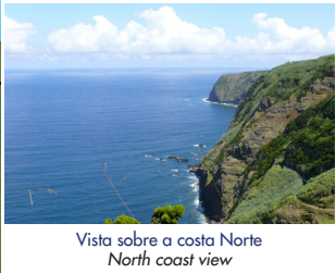
Vista sobre a costa Norte North coast view