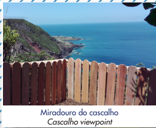
Miradouro do cascalho Cascalho viewpoint