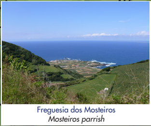
Freguesia dos Mosteiros Mosteiros parish