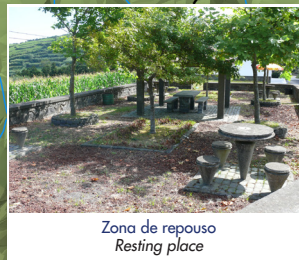
Zona de repouso Resting place