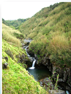
Cascatas da Ribeira Funda Waterfalls of Ribeira Funda