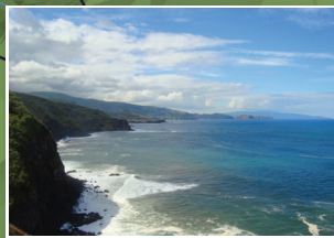
Vista da costa Noroeste View of the Northwest coast