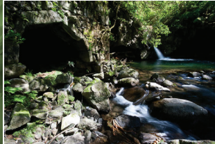
Moinhos do Crim Watermills - Moinhos do Crim