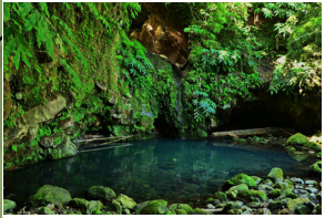
Poço Azul Poço Azul