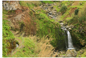
Vista para a Cascata View to the Waterfall