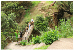
Parque de Merendas do Fojo Picnic Area Fojo