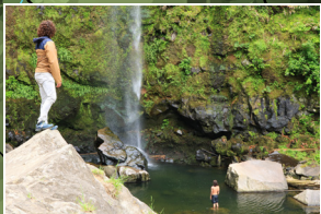
Salto da Farinha Salto da Farinha