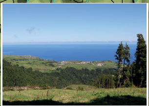
Vista sobre a costa Norte View over the North coast