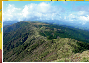
Vista do topo do Pico da Vara View from the top of Pico da Vara

Trajeto aberto Open path Trajeto interdito Prohibited path