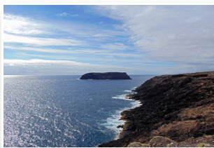
Ilhéu da Vila do Porto Vila do Porto Islet