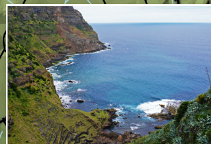
Baía do Raposo Raposo Bay