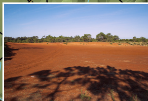
Barreiro da Faneca Barreiro da Faneca