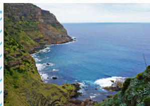
Baía do Raposo Raposo Bay