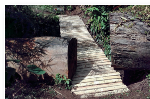
Ponte de madeira Wooden bridge