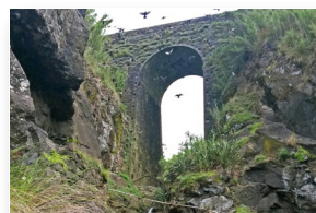
Ponte de Ferro Ferro bridge