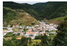
Vista para o Faial da Terra View to Faial da Terra