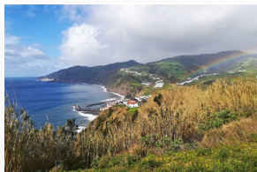
Vista para a vila da Povoação View to Povoação village