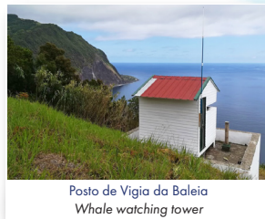
Posto de Vigia da Baleia Whale watching tower