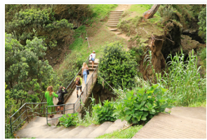
Parque de Merendas do Fojo Picnic Area Fojo