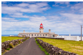
Farol da Ponta de Albernaz Lighthouse of Ponta de Albernaz