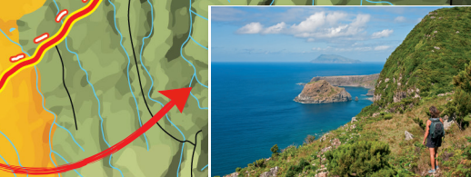
Ilhéu de Maria Vaz e vista sobre o Corvo Maria Vaz islet and view over Corvo