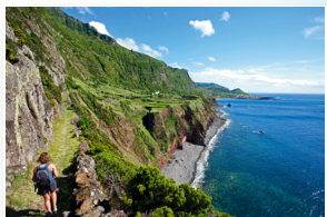
Vista sobre a Fajã Grande View over Fajã Grande