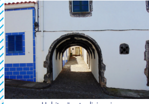
Habitações tradicionais Traditional houses