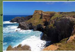
Buraco de São Pedro "Buraco de São Pedro"