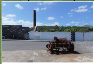
Antiga fábrica da baleia Old whale factory