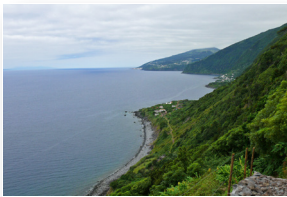
Vista sobre as Fajãs dos Bodes e Vimes View over Fajãs dos Bodes and Vimes