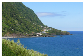
Fajã de São João ao longe Fajã de São João afar