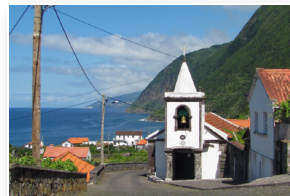
Ermida de São João São João chapel