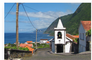
Ermida de São João São João chapel