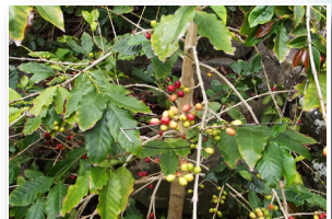
Café produzido localmente Locally produced coffee