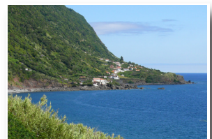
Fajã de São João ao longe Fajã de São João afar