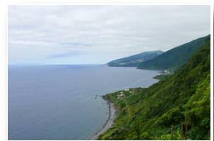
Vista sobre as Fajãs dos Bodes e Vimes View over Fajãs dos Bodes and Vimes