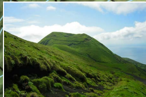
Vista para o Pico da Esperança View to Pico da Esperança