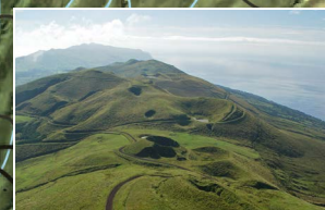
Lagoa do Pico da Esperança Pico da Esperança lake