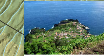
Vista para a Fajã do Ouidor View over Fajã do Ouidor