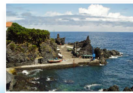
Porto/Zona balnear Harbor/Bathing area