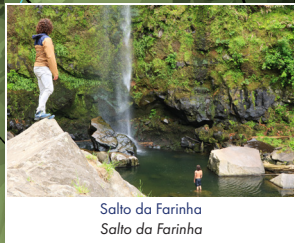
Salto da Farinha Salto da Farinha