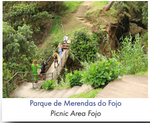
Parque de Merendas do Fojo Picnic Area Fojo