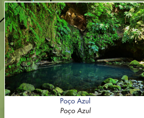
Poço Azul Poço Azul