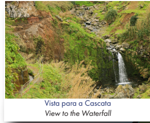
Vista para a Cascata View to the Waterfall