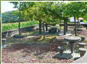
Zona de repouso Resting place