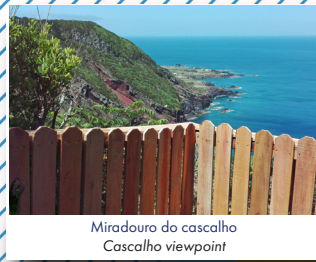
Miradouro do cascalho Cascalho viewpoint