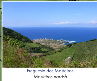
Freguesia dos Mosteiros Mosteiros parish