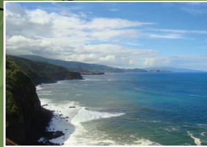
Vista da costa Noroeste View of the Northwest coast