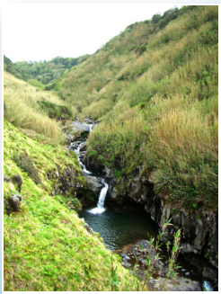
Cascatas da Ribeira Funda Waterfalls of Ribeira Funda