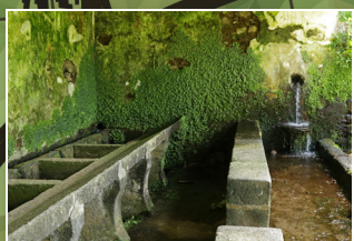
Tanques de água Water tanks