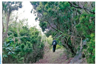
Corredor de endémicas Endemic aisle