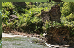
Azenha em ruínas - Moinhos do Januário Old watermill - Moinhos do Januário