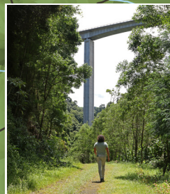
Passagem pelo viaduto da Euroscut Euroscut viadut passage