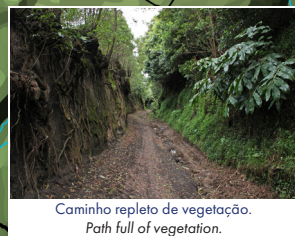
Caminho repleto de vegetação. Path full of vegetation.