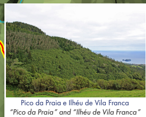
Pico da Praia e Ilhéu de Vila Franca "Pico da Praia" and "Ilhéu de Vila Franca"