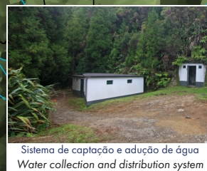
Sistema de captação e adução de água Water collection and distribution system