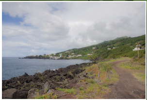
Calheta de Nesquim Calheta de Nesquim