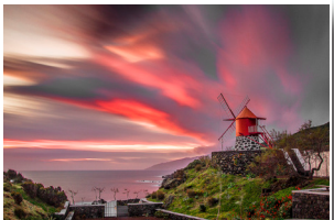
Moinho do Mourrição Mourrição Windmill