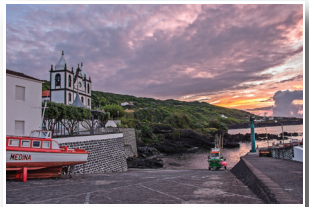
Calheta de Nesquim Calheta de Nesquim