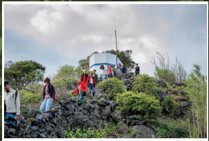
Vigia da Baleia Whale Observation Point