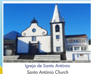
Igreja de Santo António Santo António Church