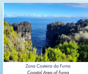
Zona Costeira da Furna Coastal Area of Furna