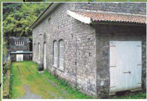
Central Hidroeléctrica da Fajã do Redondo Hydroelectric Power Plant of Fajã do Redondo