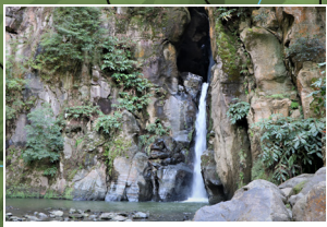
Cascata do Salto do Cabrito Salto do Cabrito Waterfall