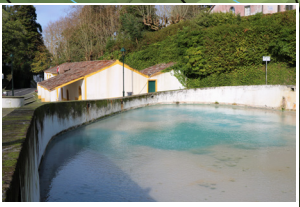
Caldeiras da Ribeira Grande Ribeira Grande Hot Springs