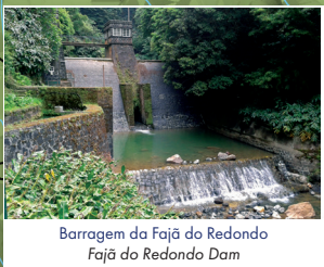
Barragem da Fajã do Redondo Fajã do Redondo Dam