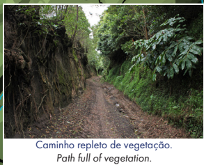
Caminho repleto de vegetação. Path full of vegetation.