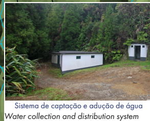
Sistema de captação e adução de água Water collection and distribution system