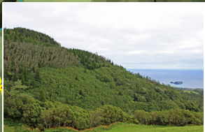
Pico da Praia e Ilhéu de Vila Franca "Pico da Praia" and "Ilhéu de Vila Franca"